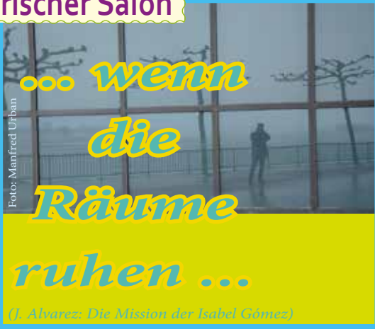
(J. Alvarez: Die Mission der Isabel Gómez)

In ihrem Roman spielen 2 Frauen eine Rolle. Die eine, die spanische Ordensschwester Isabel, kommt 1803 in die südamerikanischen Kolonien, um die Menschen gegen das tödliche Pockenvirus zu impfen. Davon erfährt 200 Jahre später die Schriftstellerin