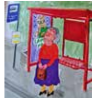
Haltestelle, wartende Frau Ill. von Anete Melece aus Hallo, Walfisch

Bei einem Stern passt eine kurzer Text aus dem Buch besonders gut. Die Texte findest du im Anschluss an die Wegbeschreibung. Tipp: Vorher üben alle 1 Zitat ein, um dieses an Ort und Stelle vorzulesen