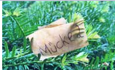
Mücke, Versteck vor dem Spaziergang das Schild und lass es am Ende suchen

Geradeaus = über das Schulgelände gehen und dann neben dem Friedhof weitergehen bis kurz vor das Friedhofs-Tor; hier nach rechts wenden